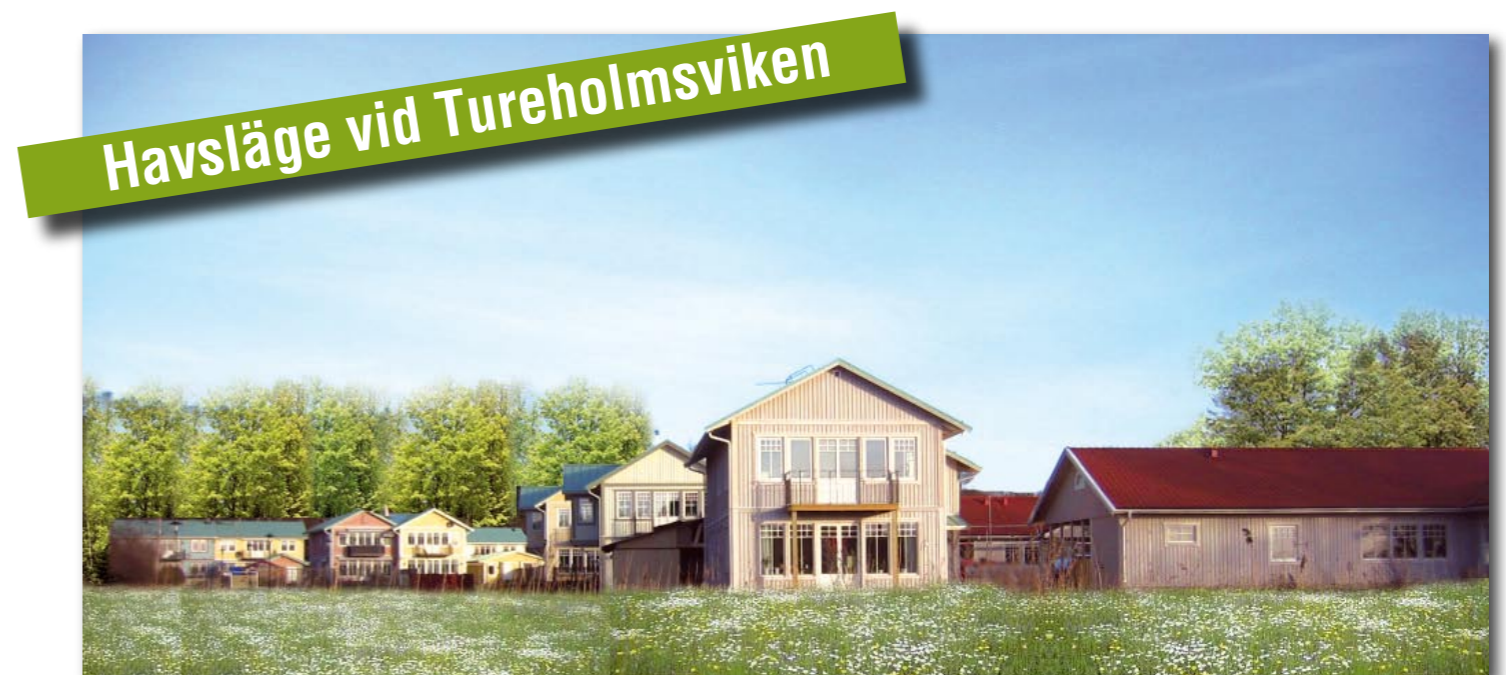
Fotomontage Skärgårdsängen, Trosa