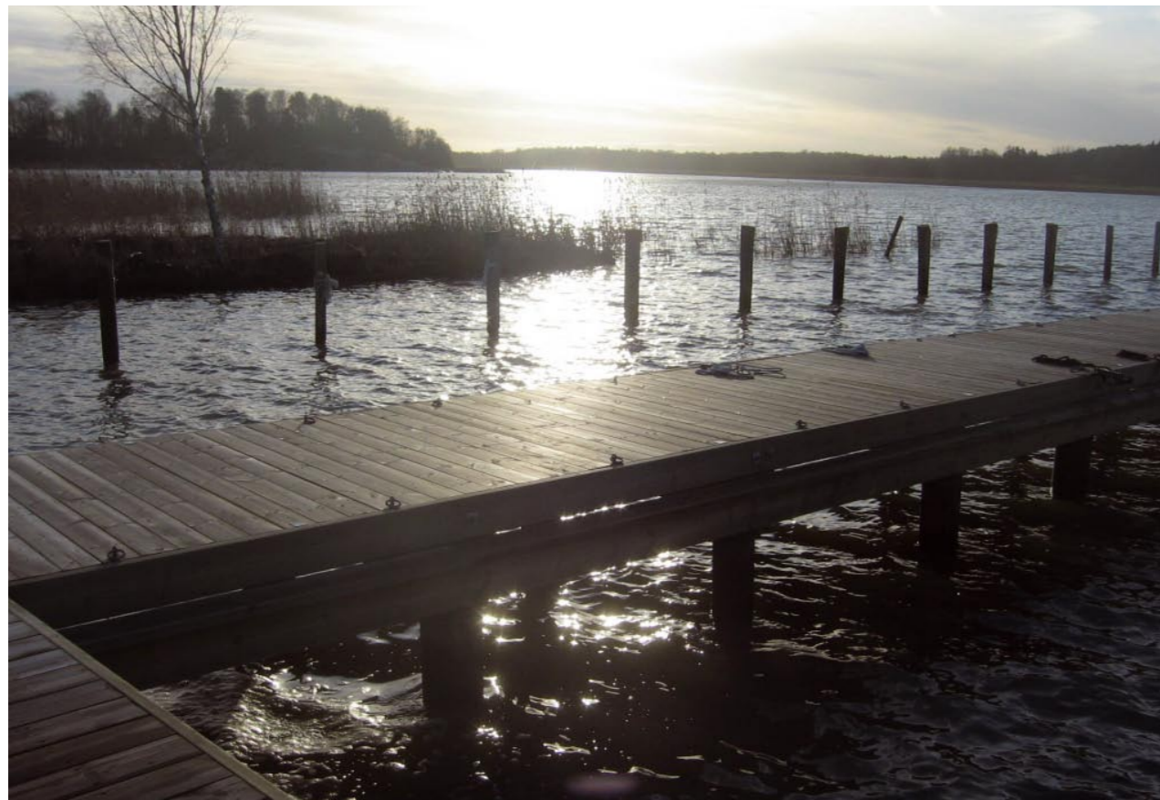
Havsnära tomter. Båtplats ingår.